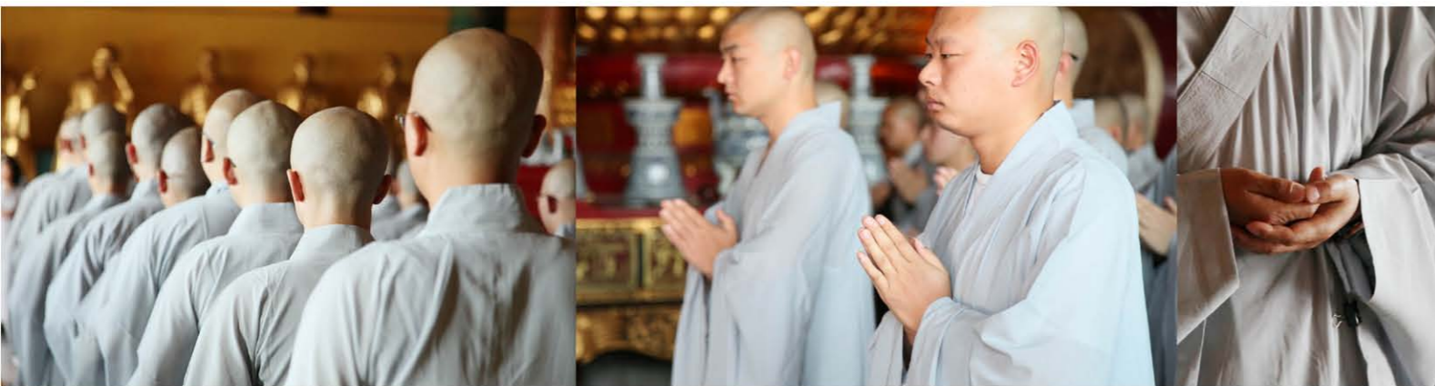
癸巳年国庆短期出家禅修班

文殊当理，普贤当行。理者，真空无碍之理；行者，离相无尽之行。观音当大慈，势至当大智。维摩者，净名也。净者，性也，名者，相也，性相不异，故号净名。诸大菩萨所表者，人皆有之，不离一心，悟之即是。今学道人，不向自心中悟，乃于心外着相取境，皆与道背。恒河沙者，佛说是沙，诸佛、菩萨、释梵诸天步履而过，沙亦不喜；牛羊虫蚁践踏而行，沙亦不怒。珍宝馨香，沙亦不贪；粪尿臭秽，沙亦不恶，此心即是无心之心。离一切相，众生诸佛，更无差别，但能无心，便是究竟。